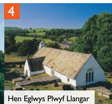
Hen Eglwys Plwyf Llangar

Mae Capel y Rug yn sefyll yng nghanol coed deniadol, ond nid yw golwg allanol y capel yn rhoi unrhyw awgrym o'r rhyfeddodau hynod addurniadol a lliwgar y tu mewn. Camwch i mewn i'r adeilad o'r 17eg ganrif a chewch eich synnu gan y gwaith addurniadol. Ryw filltir i ffwrdd, mae Hen Eglwys Plwyf Llangar ychydig ganrifoedd yn hŷn ac mae ei dodrefn hyfryd o ddechrau'r cyfnod Sioraidd a chyfres bwysig o furluniau wedi'u cadw.