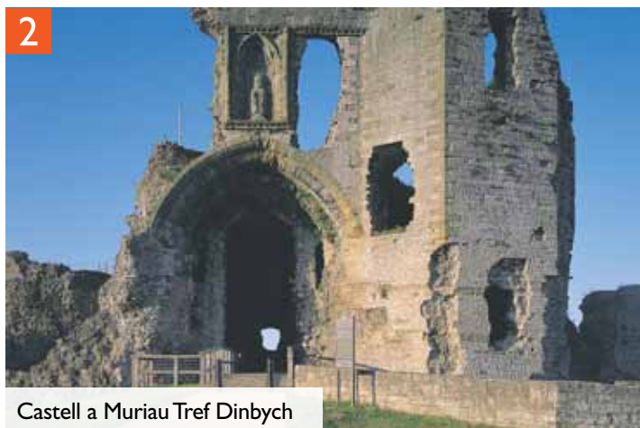
Castell a Muriâu Tref Dinbych

Rhuddlan , sy'n gwarchod hen ryd dros afon Clwyd, oedd y cryfaf o gestyll Edward I yn y Gogledd-ddwyrain. Mae wedi'i gysylltu â'r môr gan sianel ddofn bron tair milltir o hyd, ac mae'n dal yn dyst i athrylith arloesol y pensaer. Am ganrifoedd, bu Rhuddlan yn lleoliad strategol a welodd lawer o frwydro gwaedlyd. Llwyddodd Edward i atal yr ymosodwyr yn ddigon hir i adeiladu castell cymesur cadarn gan ddefnyddio'r dechnoleg 'muriâu o fewn muriâu' ddiweddaraf. Chwaraeodd y castell ran allweddol hefyd yn hanes Cymru; yma y cafodd system newydd o lywodraeth Seisnig ei sefydlu dros lawer o Gymru gan Statud Rhuddlan (1284) - setliad a barhaodd tan y Ddeddf Uno yn 1536. Ar ôl Rhyfel Cartref Lloegr bernid bod y castell yn amhosibl ei gynnal, ac arweiniodd hyn at ei gyflwr presennol.