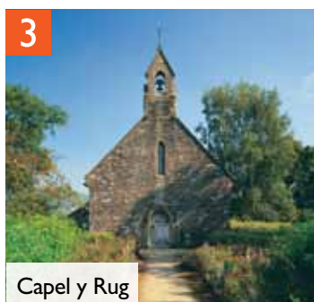
Capel y Rug

Mae Castell a Muriâu Tref Dinbych yn sefyll ar frigiad craig amlwg uwchben Dyffryn Clwyd, a'r brif nodwedd yw'r porthdy mawr a'i dri thŵr sy'n dyddio yn ôl i'r 13eg ganrif. Gan fod yno fwy na hanner milltir o furiau tref hefyd, mae Castell Dinbych yn gaer glasurol yn null Edward. Rhoddwyd y cyfrifoldeb o reoli'r ardal ac adeiladu'r castell newydd i Henry de Lacy, un o gadlywyddion ffyddlon y brenin. Cafodd y castell ei gipio ym 1294 tra oedd yn cael ei adeiladu yn sgil gwrthryfel y Cymry o dan arweiniad Madog ap Llywelyn, ond nid oedd yn hir cyn i Edward ailafael arno a pharhau â'r rhaglen adeiladu. Gallwch weld dau gyfnod y gwaith adeiladu eich hun. Nodir y gwaith a wnaethpwyd ar ôl y gwrthryfel gan gerrig o liw gwahanol, llenfuriau tewach a thyrau ongl fel y rhai a geir yng Nghaernarfon. Peidiwch ag anghofio chwaith am Eglwys Leicester, Tŷ'r Brodyr a Phorth y Bwrdeisiaid.