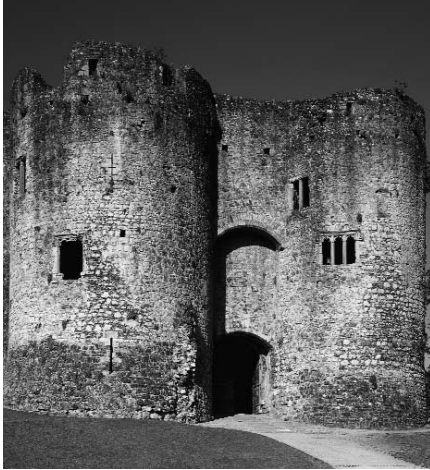
Y porthdy gyda dau dŵr sy'n gwarchod y fynedfa i'r castell.