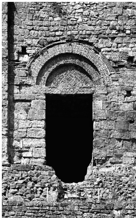
Y drws i'r tŵr mawr.