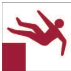
Disgynfeydd peryglus Unprotected drops