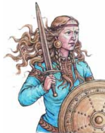
Gwenllian: Rhyfelwraig o Gymru

Roedd Gwenllian yn dywysoges ddewr a hardd o Gymru a fu farw'n ceisio achub ei gwlad rhag goresgyniad y Normaniaid. Roedd yn ferch i Gruffudd ap Cynan, llywodraethwr Gwynedd (gogledd Cymru).