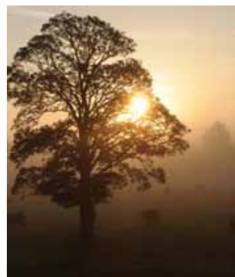
Dyffryn Tywi ble dihangodd Gwenllian

Cafodd Gwenllian a Maelgwn eu dal. Ni ddangosodd Maurice de Londres unrhyw drugaredd – er mwyn dangos esiampl i holl dywysogion Cymru, dienyddiodd Gwenllian am frad. Yn ôl y sôn, cododd ffynnon i'r golwg yn y fan ble bu farw'r Dywysoges Gwenllian ddewr – llecyn sydd wedi cael yr enw Maes Gwenllian erbyn hyn.