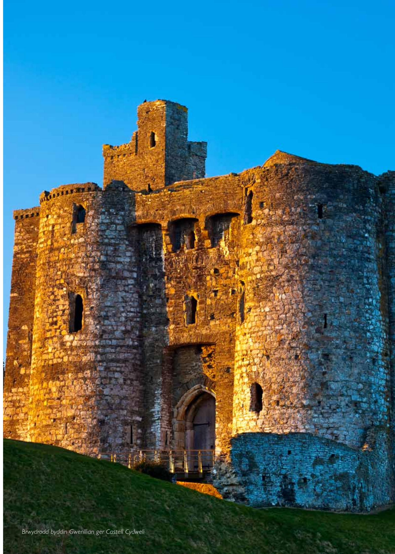
Brwydrodd byddin Gwenllian ger Castell Cydweli