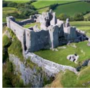
Castell Carreg Cennen