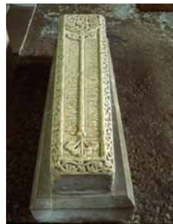
Beddfaen Maurice de Londres ym Mhriordy Ewenni