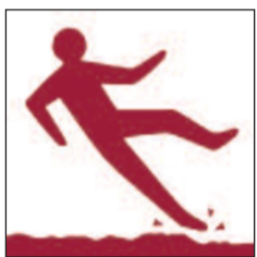
Lloriau anwastad neu lithrig Uneven or slippery surfaces