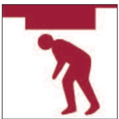
Toeau isel Low headroom