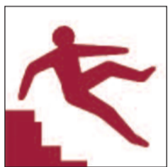
Grisiau anwastad, serth a chul Uneven, steep or narrow stairs

Ceir rhai o'r arwyddion rhybudd canlynol, neu bob un ohonynt, ar y safle hwn. Some or all of the following warning signs can be found situated around the site.