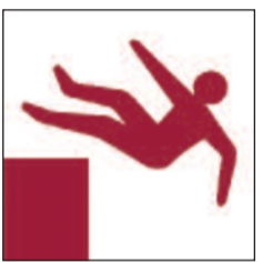
Disgynfeydd peryglus Unprotected drops