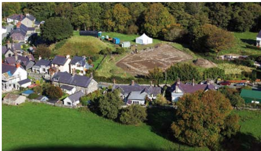
Mae'r domen, y credir ei bod yn domen castell (Ymweliad 1), ar y chwith yn y llun yma o'r cloddio yn Abergwynnregyn yn 2010