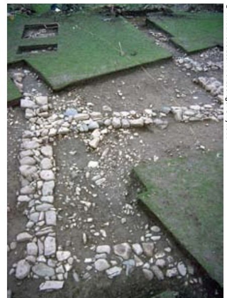
Sylfeini'r neuadd wedi'u datgelu gan waith cloddio 1993