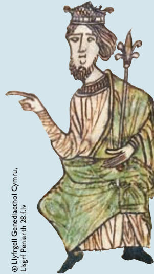
Llyfr Peniarth 28.f.iv

Yn ogystal â'u gwasanaethau llafur, roedd yn rhaid i'r taeogion dalu taliadau