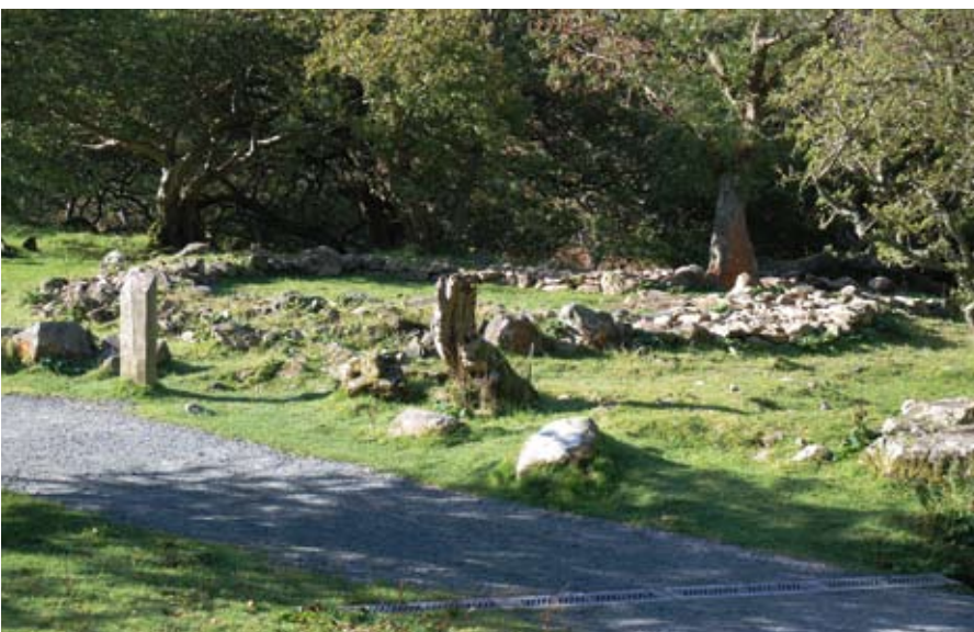
Y tŷ crwn o Oes yr Haearn a ddaeth yn safle i odyn sychu grawn yn y Canol Oesoedd (Ymweliad 4)