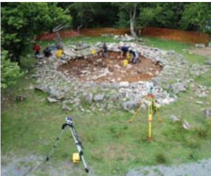
Safle'r tŷ crwn yn ystod y cloddio