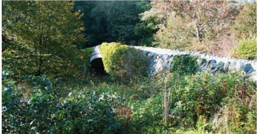
Bont Newydd (Ymweliad 2)

Mae bryngaer o Oes yr Haearn, Maes y Gaer, uwch eich pen i'r gogledd-ddwyrain ac roedd llwybr hynafol yn arfer mynd o Ddyffryn Conwy dros y mynyddoedd gan ddod i lawr at Bont Newydd cyn parhau ar lanw isel ar draws tywod Traeth Lafan i Lanfaes yn Ynys Môn. Roedd y man croesi yn brysus nes codi Pont Menai gan Telford yn y bedwaredd ganrif ar bymtheg. Mae safle strategol Aber yn rhannol esbonio presenoldeb y fryngaer, y mwnt a'r llys.