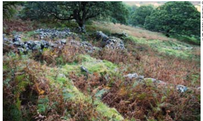
Nodwyd bod dau o'r adeiladau yn y clwstwr hwn o gytiau hir yn deillio'n ôl i'r drydedd ganrif ar ddeg (Ymweliad 3)