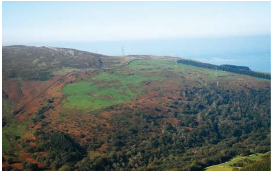
Mae tirwedd Cae'r Mynydd (Ymweliad 5) yn dangos olion caeau ac aneddiadau o Oes yr Haearn, yn ogystal ag aredig canoloesol a chytiau hir