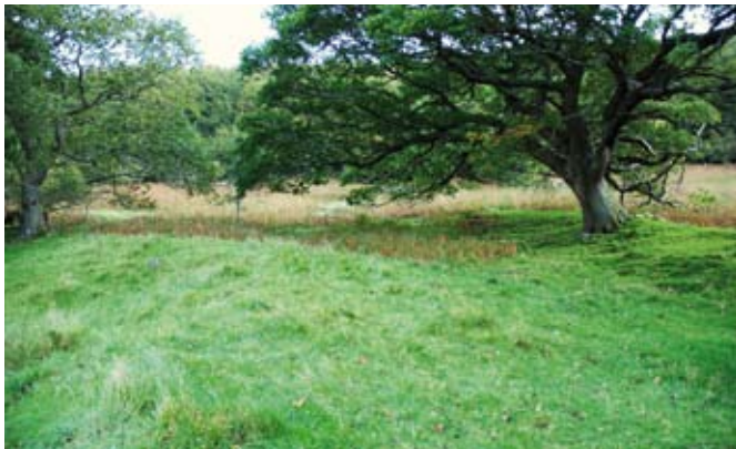
Linsiedi yw'r cloddiau yn y llun hwn, wedi eu creu gan aredig cyson (Ymweliad 3)

Cafodd y grŵp hwn ei gloddio yn 1961. Mae'r rhan fwyaf yn dyddio o'r ddeunawfed ganrif a dechrau'r bedwaredd ganrif ar bymtheg ac, yn ôl pob tebyg, yn olion llaethdy. Fodd bynnag, mae'r pâr top (annedd ac ysgubor) yn hŷn, wedi eu torri i mewn ar ongl sgwâr i lethr y bryn ac erbyn hyn wedi eu gorchuddio'n rhannol gan y gorlan. Roedd crochenwaith a ddarganfuwyd yno'n eu dyddio nhw i'r drydedd ganrif ar ddeg.