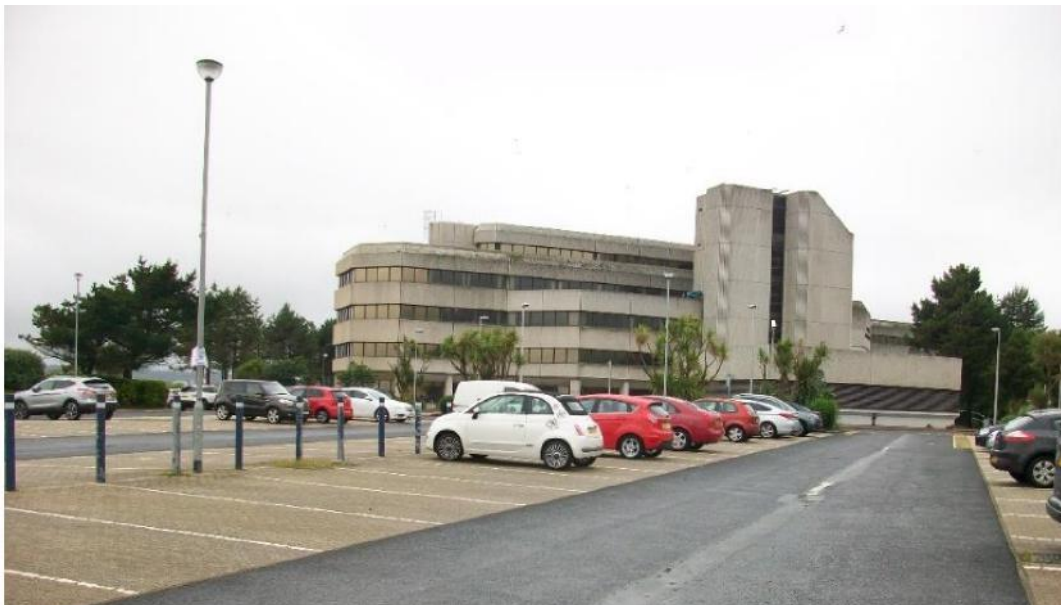
Ffig 22 Neuadd y Sir Gorllewin Morgannwg, Abertawe

Cynlluniwyd Neuadd y Sir enfawr â ffrâm goncrid ar gyfer Gorllewin Morgannwg yn Abertawe gan Adran Penseiri Sir Gorllewin Morgannwg (cyfarwyddwr J. Webb) rhwng 1979 a 1984. Roedd yn cynnwys murluniau gan Ceri Richards.