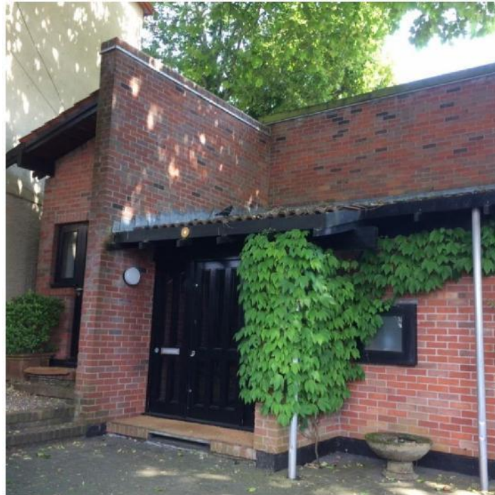
Ffig 9 Courtyard House, Llandaf

'...fits well into the street scene of Victorian villas in terms of its scale and materiality. It continues Brooks's idiosyncratic evocation of Nordic modernism as a distinct post-war housing theme in Wales.' 33