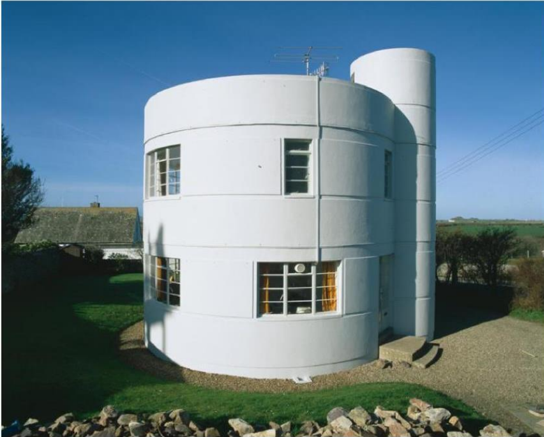
Ffig 6 Tŷ Crwn, Tyddewi