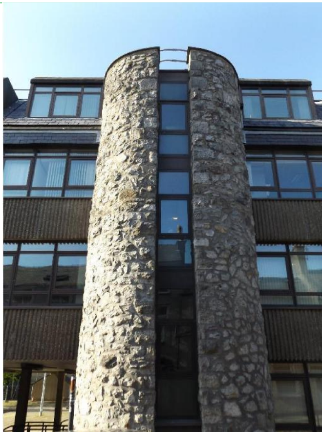
Ffig 24 Swyddfa'r Goron, Caernarfon