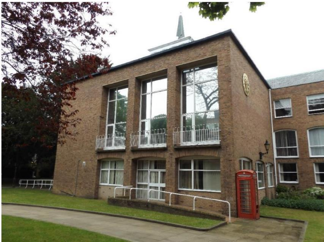
Ffig 19 Neuadd y Dref Wrecsam