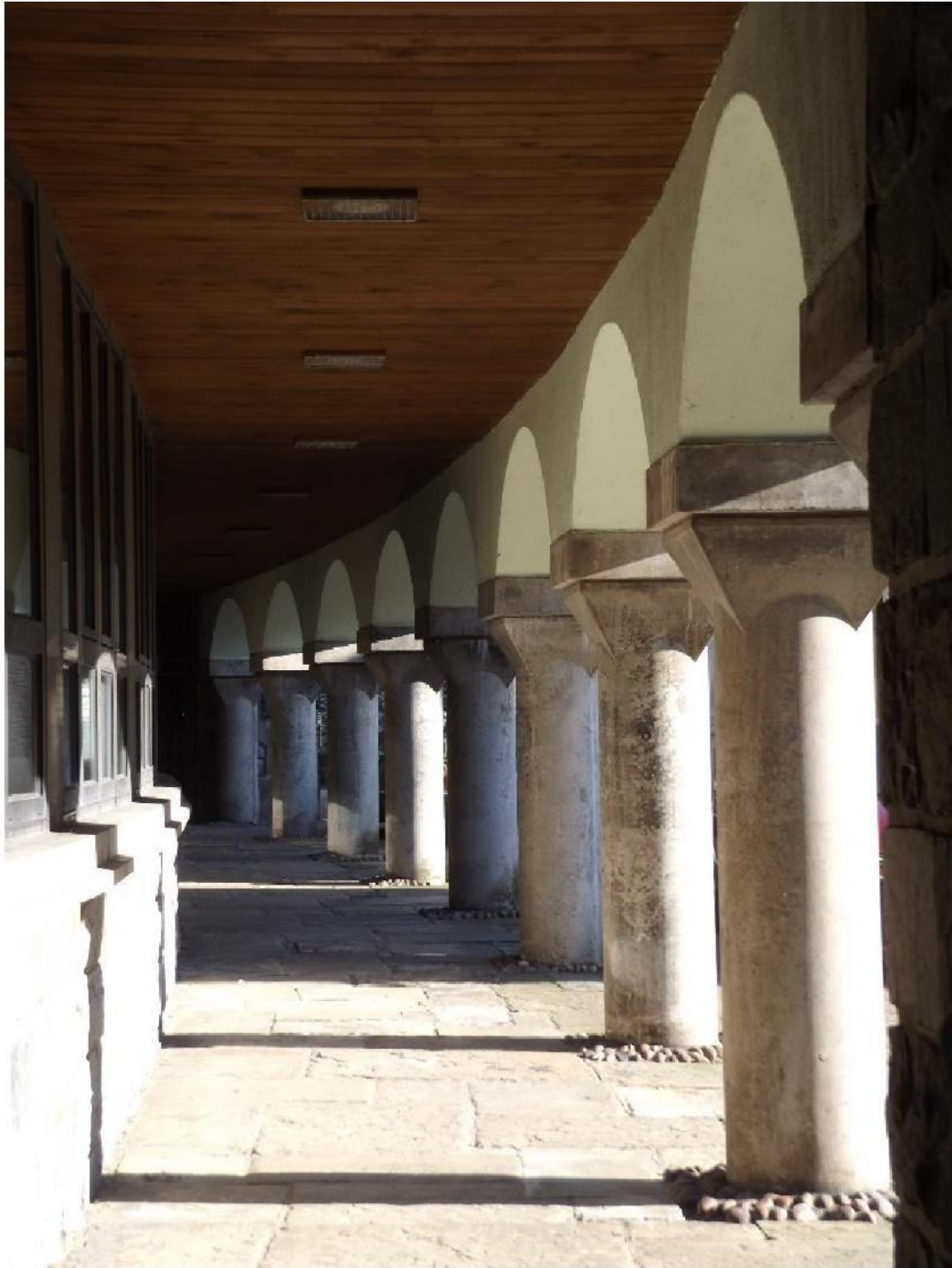
Ffig 23 Pencadlys, Caernarfon