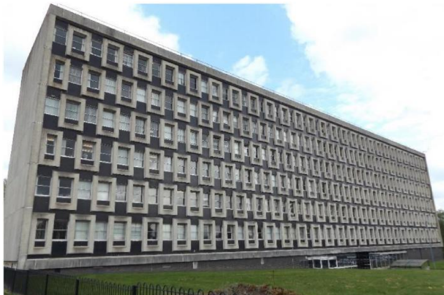
Ffig 20 Swyddfeydd Cyngor Sir y Fflint, yr Wyddgrug