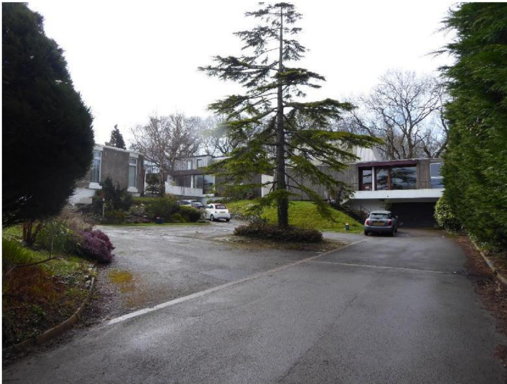
Ffig 10 Little Orchard, Dinas Powys

yn gweddu i'w gilydd – trwy wydriad mawr uchder llawn – ac mae cynllun yr ystâd fach yn hynod fanwl a chyson. Nid oes syndod bod y datblygiad wedi ennill Gwobr y Gymdeithas Goncrïd ym 1969, Medal Tai'r Swyddfa Gymreig ym 1968, a'r fedal aur ar gyfer pensaernïaeth yn Eisteddfod Hwlfford ym 1972.