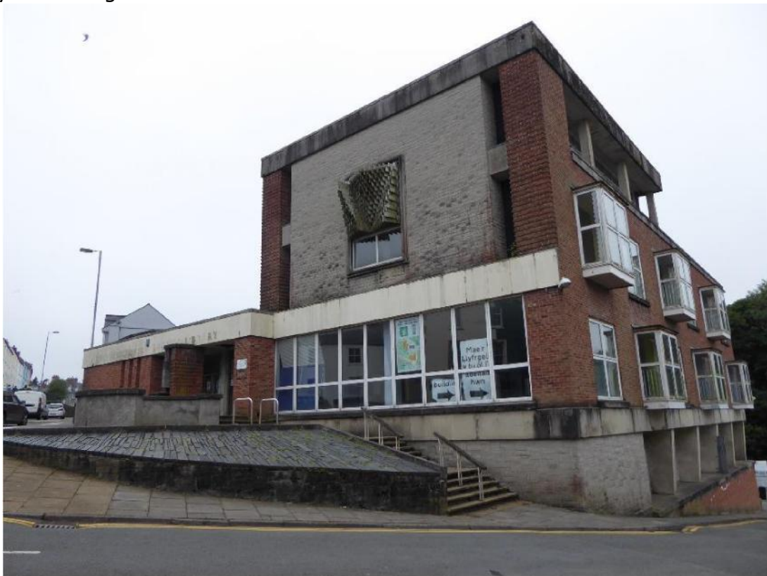
Ffig 17 Llyfrgell Hwlfordd