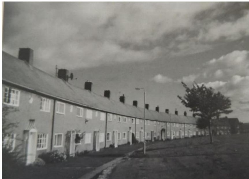
Ffig 2 Elwy Road estate, Rhos on Sea

"...his sense of background and meticulous care for apt materials and appropriate detailing set a standard that has not been without its effect in raising those of others less sensitive than himself." 12