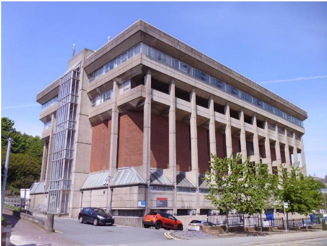
Ffig 15 Adeilad Sŵoleg Prifysgol Bangor