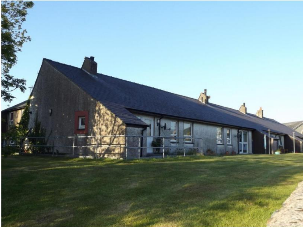
Ffig 11 Hafan Elan, Llanrug

a'r Fedal Aur ar gyfer Pensaernïaeth yn yr Eisteddfod Genedlaethol yn yr un flwyddyn. Ymhlith y gwaith blaenorol a enillodd wobrau oedd Trinity Court, Y Rhyl (1978) – fflatiau ar gyfer yr henoed, ac ym 1980, Llain Deiniol, Bangor a oedd yn cynnwys tai newydd ar gyfer ymddiriedolaeth tai ger wal gadw Ysgol yr Eglwys y Santes Fair o'r cyfnod Fictoraidd.