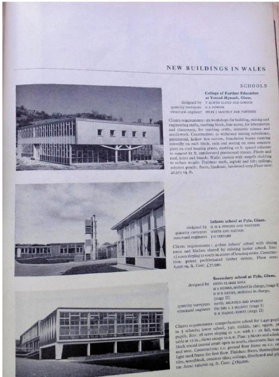
Fig. 13. Rhan o rifyn arbennig o 'The Architects' Journal', 11 Mehefin, 1959.