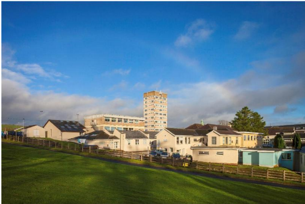
Ffig 16 Coleg y Drindod Caerfyrddin

Foulkes a'r Partneriaid, sy'n annisgwyl o ystyried ei arddull garw digyfaddawd.