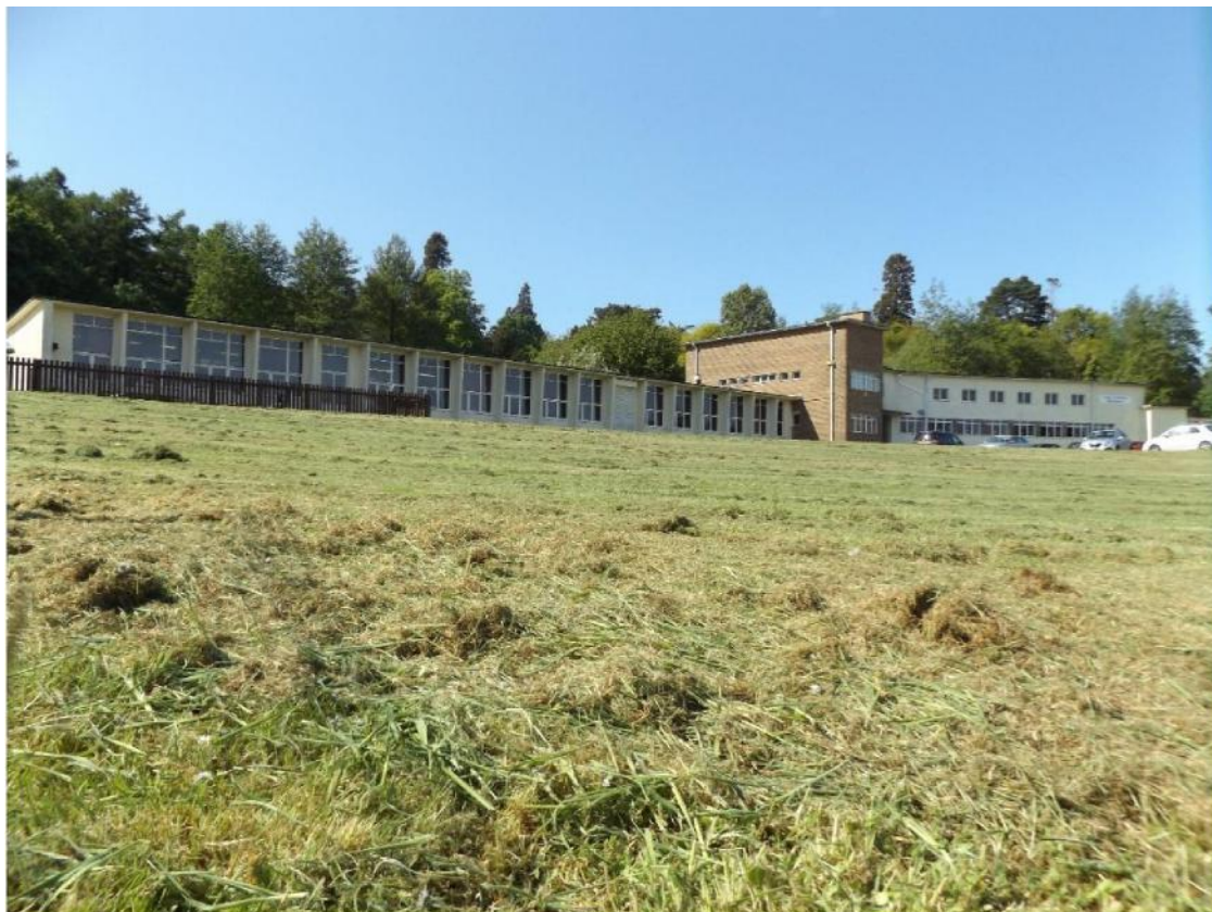
Ffig 12 Ysgol Gynradd, Biwmares

building tradition, local stone from the Moelfre Quarries has been used for the ground floor and the gables. 38 Defnyddiwyd yr un math o furiau rwbel wedi'u sgwario'n arw ar gyfer elfen fwyaf trawiadol y cynllun, sef tŵr amlwg yr ysgol. Cafodd y gwaith brics ei rendro mewn plastr garw er mwyn gweddu i'r garreg. Cynlluniwyd ysgolion cynradd eraill yn Ynys Môn – a'r ysgol gyntaf oedd Ysgol Gynradd, Biwmares (Ffig 12).