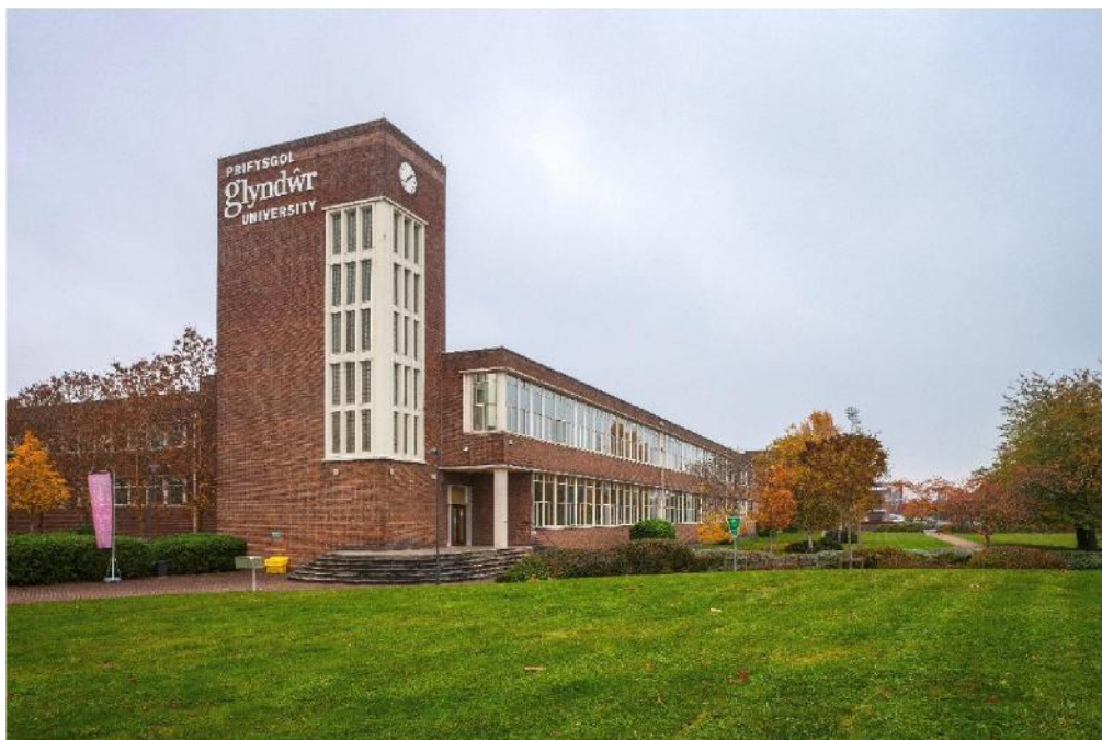
Ffig 14 Yr hen Goleg Technegol, Wrecsam