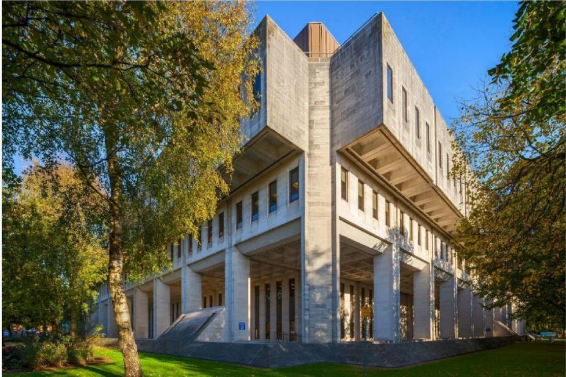
Ffig 21 Y Swyddfa Gymreig, CP2, Parc Cathays, Caerdydd

Cynlluniwyd Neuadd y Sir enfawr â ffrâm goncrid ar gyfer Gorllewin Morgannwg yn Abertawe gan Adran Penseiri Sir Gorllewin Morgannwg (cyfarwyddwr J. Webb) rhwng 1979 a 1984. Roedd yn cynnwys murluniau gan Ceri Richards.