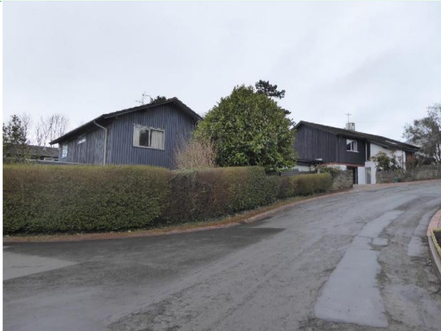
Ffig 7 Elm Grove Lane, Dinas Powys

'As one-off designs these would be impressive, but as speculative development they seem little short of miraculous.' 32