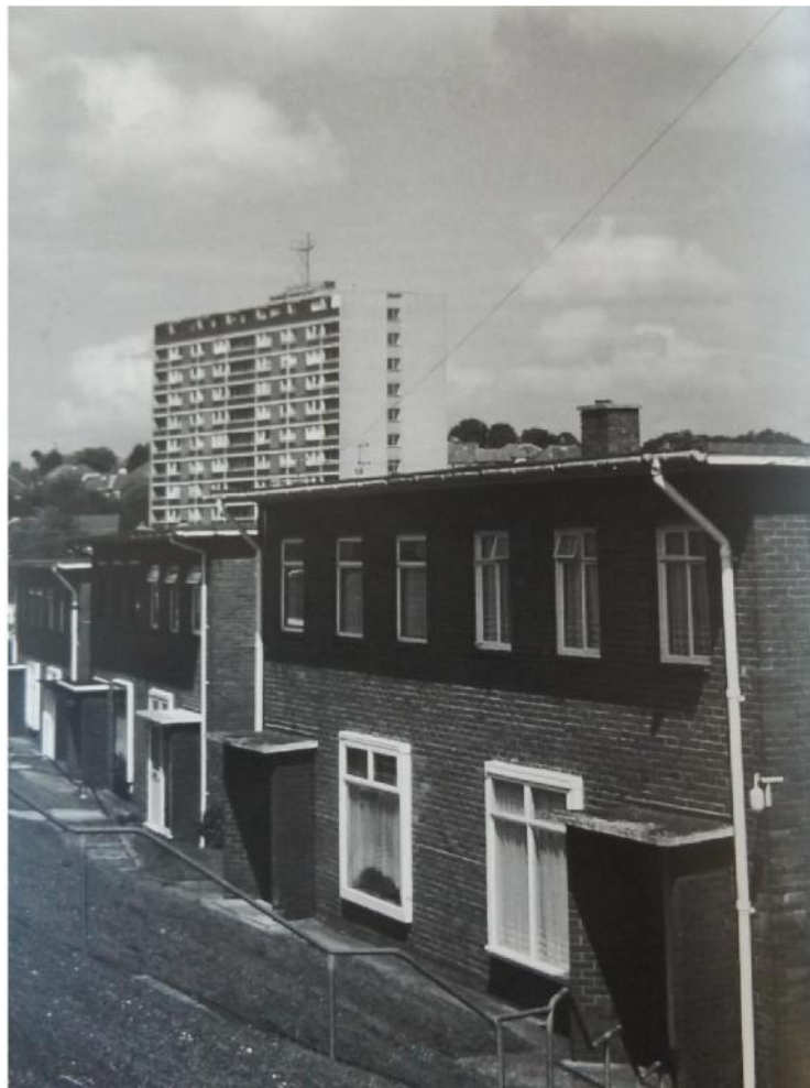
Ffig 3 Ystâd Gaer, Casnewydd

Stelvio i gartrefu 3,900 ar safle 163 erw. 16 Roedd hon yn un o bedair ystâd fawr ar ôl y rhyfel a gynlluniwyd gan y Cyngor i greu 1,328 o dai. Erbyn 1959 roedd wedi adeiladu dros 5,000 o dai a fflatiau. Oherwydd gofynion byd diwydiant ac amaeth ar gyfer tir gwastad, roedd y safleoedd ar gyfer tai wedi'u cyfyngu i'r tir bryniog yng nghyffiniau Casnewydd. Cafwyd amrywiaeth o barau o dai tair ystafell wely gyda thoeau ar ongl, a therasau to gwastad, tair ystafell wely a oedd yn grwm weithiau — ac roedd gan rai ohonynt furiau allanol lliw yn cyferbynnu â manau bric plaen.