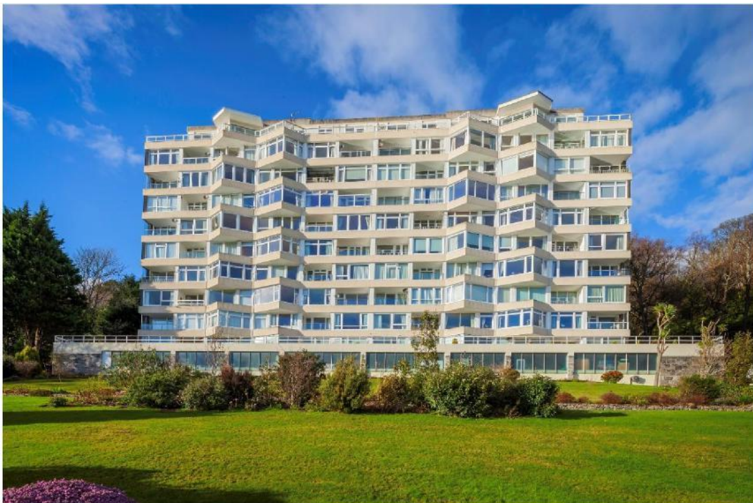
Ffig 5 Llys Glyn Garth, Porthaethwy

Ychydig iawn o fflatiau preifat moethus a adeiladwyd ar raddfa fawr. Fodd bynnag, mae Clos Sain Niclas, Heol Sain Niclas, y Barri , gan Powell ac Alport ym 1964, a Llys Glyn Garth, Porthaethwy , (1971) yn enghreifftiau da o fflatiau o'r fath. Mae Glyn Garth (Ffig 5) yn floc o flatiau slab un llawr ar ddeg wedi'i leoli mewn lle braf wrth ymyl Afon Menai. Cynlluniwyd y fflatiau gan Syr Percy Thomas a'i Fab. Lleolir Llys Glyn Garth ar dir hen Blas Esgob Bangor, ac mae gan y fflatiau ddwy res ddwbwl o falconïau croeslinol sy'n ychwanegu nodwedd fasedaidd at glogwyn serth golwg blaen eang yr adeilad. Mae concriid bwsh wedi'i ddefnyddio i orchuddio tyrrau'r lifft cefn, ac mae maint y datblygiad ond yn weladwy o gyfeiriad y môr gan fod coetir trwchus yn cuddio'r fflatiau o gyfeiriad y ffordd i Fiwmares. Ymddangosodd yr adeilad mewn rhifyn o 'Architecture Wales' ym 1967 a oedd yn canolbwyntio ar adeiladau yn Ynys Môn. Yn yr un rhifyn, cyferbynnwyd byngalo chalet mawr â chynllun traddodiadol gan Lingard a Chymdeithion ym Mhorthaethwy â thŷ modernaidd gan Brettell a Harries (ni nodwyd y lleoliad) ym Miwmares – a ddisgrifiwyd gan 'Architecture Wales' fel '...a happy marriage between modern architecture and the grain of the environment.'