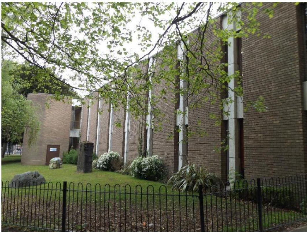
Ffig 18 Llyfrgell Wrecsam