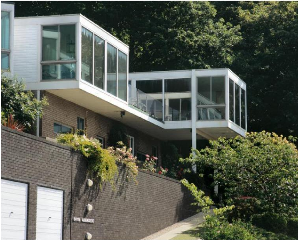
Ffig 4 Bryn Aberoedd, Aberystwyth

(Ffig 4) sy'n cael ei ddisgrifio gan 'Buildings of Wales' fel tŷ sydd â 'spare elegance in glass, brick and white aluminium'.