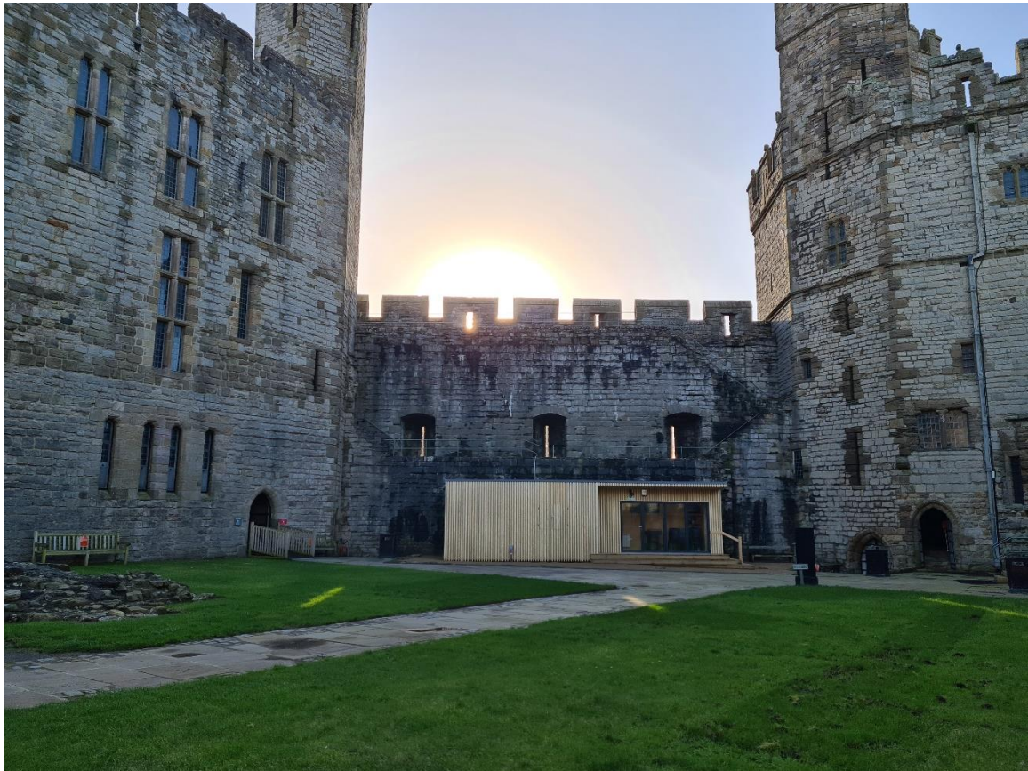
CADW CASTELL CAERNARFON, CYTUNDEB MEDDIANNAETH CIOSG DROS DRO. IONAWR, 2021. TUDALEN 11