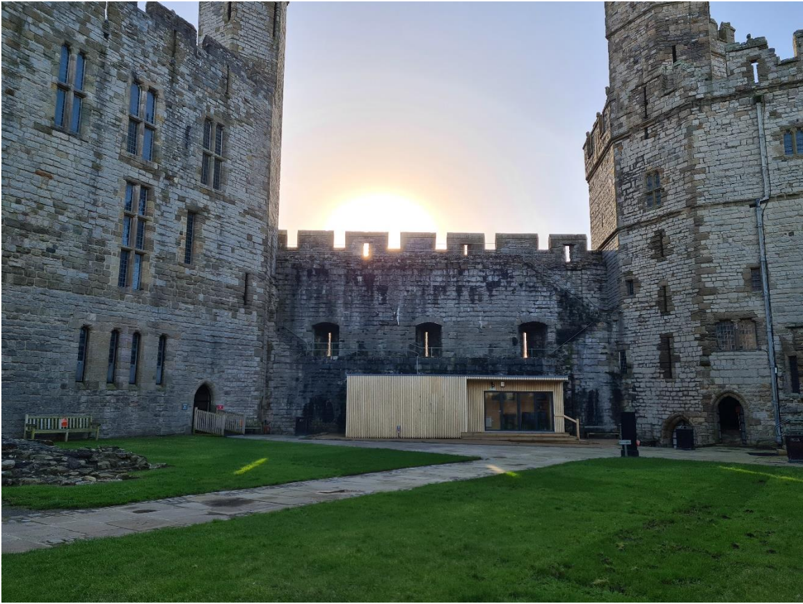
Lleoliad y Ciosg Dros Dro yng Nghastell Caernarfon.